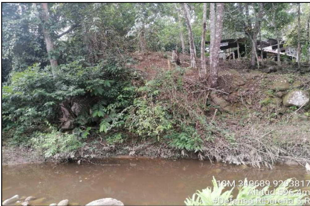
FOTOGRAFIA N°01: LINEA DE DESCARGA DE LA PTAR AFECTADA POR LA EROSION DEL RIO CUMBAZA