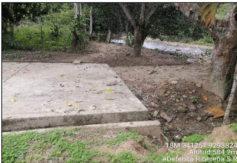
FOTOGRAFIA N°02: ESTADO DE COLMATACIÓN DEL CAUCE